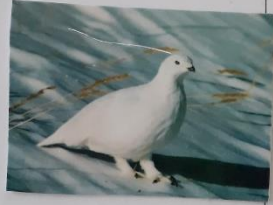
Животные и птицы Тундры Красноярского края

Ход игры: Ребенку предлагается классифицировать обитателей Красноярского края по принципу имеется оперение- не имеется оперение назвать его.