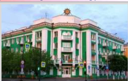
Красноярский краевой госпиталь ветеранов войн

В 1945 году в крае оставили лишь эвакуогоспиталь №985. Сегодня это краевой госпиталь для ветеранов войн (он расположен в двух корпусах, на Мира, 99 (фото ниже) и Вильского, 11). Это единственное в нашем регионе специализированное учреждение, оказывающее медицинскую помощь ветеранам Великой Отечественной войны, блокадникам Ленинграда, узникам концлагерей и гетто, пострадавших от политических репрессий, и реабилитированным, труженикам тыла и ветеранам труда.