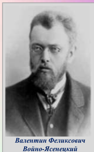
Валентин Феликсович Войно-Ясенецкий

Все 60 госпиталей были переполнены. Раненых бойцов доставляли к ним на подводах. А студенты и медработники сутками дежурили на железнодорожном вокзале в ожидании эшелонов с передовой. Бессонные ночи, голод, страдания раненых, смерть – все это приходилось переживать медикам. Хирурги часами проводили сложнейшие операции. Рабочий день длился двенадцать часов. И дольше для тех, кто мог оставаться на ногах. Врачи страдали от переутомления и истощения, падали в голодные обмороки. И не потому, что не было питания, а от нехватки времени. Каждая минута была на счету, ведь во время еды можно было спасти еще чью-то жизнь.