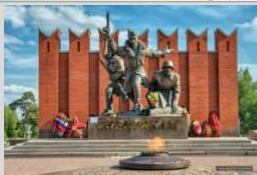
Памятник сибирским дивизиям в Московской области

Из Сибирского военного округа за четыре военных года ушли на фронт свыше 2 миллионов 600 тысяч человек. Красноярский край занимал первое место по мобилизации людских ресурсов в округе. По официальным данным, за годы войны на фронт ушло 455 000 красноярцев, а это каждый пятый житель края, из них 165 000 человек не вернулись.